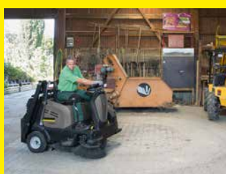
Kehr- u. Kehrsaugmaschinen