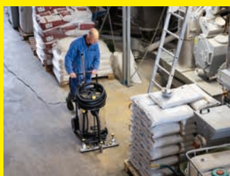
Multifunktions-Flächensauger NT 75/2 Tact² Adv Farmer