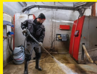
Stationäre Melkstandreiniger HD 10/21 und HD 13/18-4 S St Classic Plus Farmer